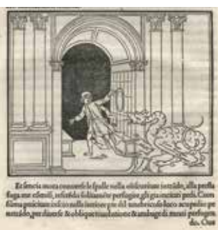
F. Colonna, Hyperotomachia Poliphili , Venezia, Aldo Manuzio, XII 1499 (BML Rés inc 1047)